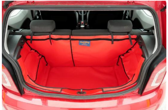
BILD ZEIGT GETEILTER RÜCKSITZ VORBEREITET FÜR DEN SITZSCHONER